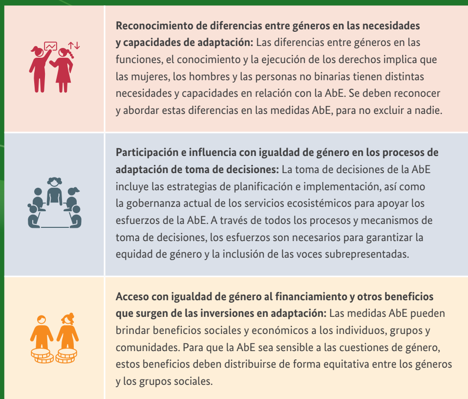
Figura 1: Elementos de un enfoque sensible a las cuestiones de género 85

A través de todas las dimensiones, se necesita un enfoque interseccional para comprender y abordar las diferencias entre las personas del mismo género según su raza, edad, orientación sexual, situación socioeconómica, indigeneidad y otros factores que influyen en sus funciones y experiencias, y las formas de discriminación que enfrentan. Como se mencionó anteriormente, las medidas AbE deben integrarse en los sistemas más amplios de gobernanza y los procesos de cambio social para lograr los cambios sistémicos necesarios para alcanzar la igualdad de género y la inclusión social.