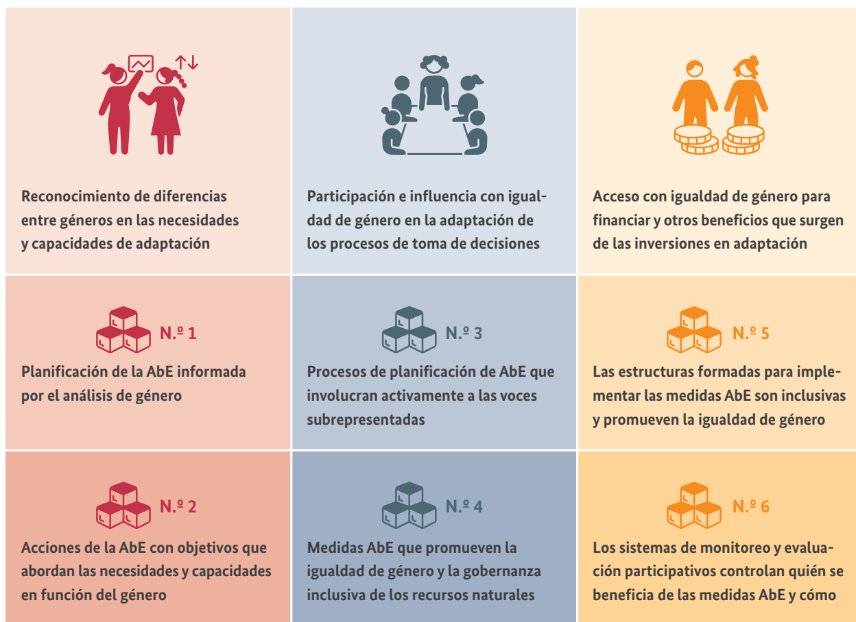
Figura 2: Elementos constitutivos de un enfoque sensible a las cuestiones de género

género, lo que brinda cuestiones específicas para planificar e implementar las medidas AbE. Dado que la sensibilidad a las cuestiones de género depende mucho del contexto y del proceso iniciado, estos elementos constitutivos representan los enfoques que se aplican de forma general y que pueden ayudar a garantizar que las iniciativas AbE promuevan la igualdad de género y no exacerben las desigualdades existentes. Las siguientes secciones explican los distintos elementos constitutivos y cómo pueden ponerse en práctica.